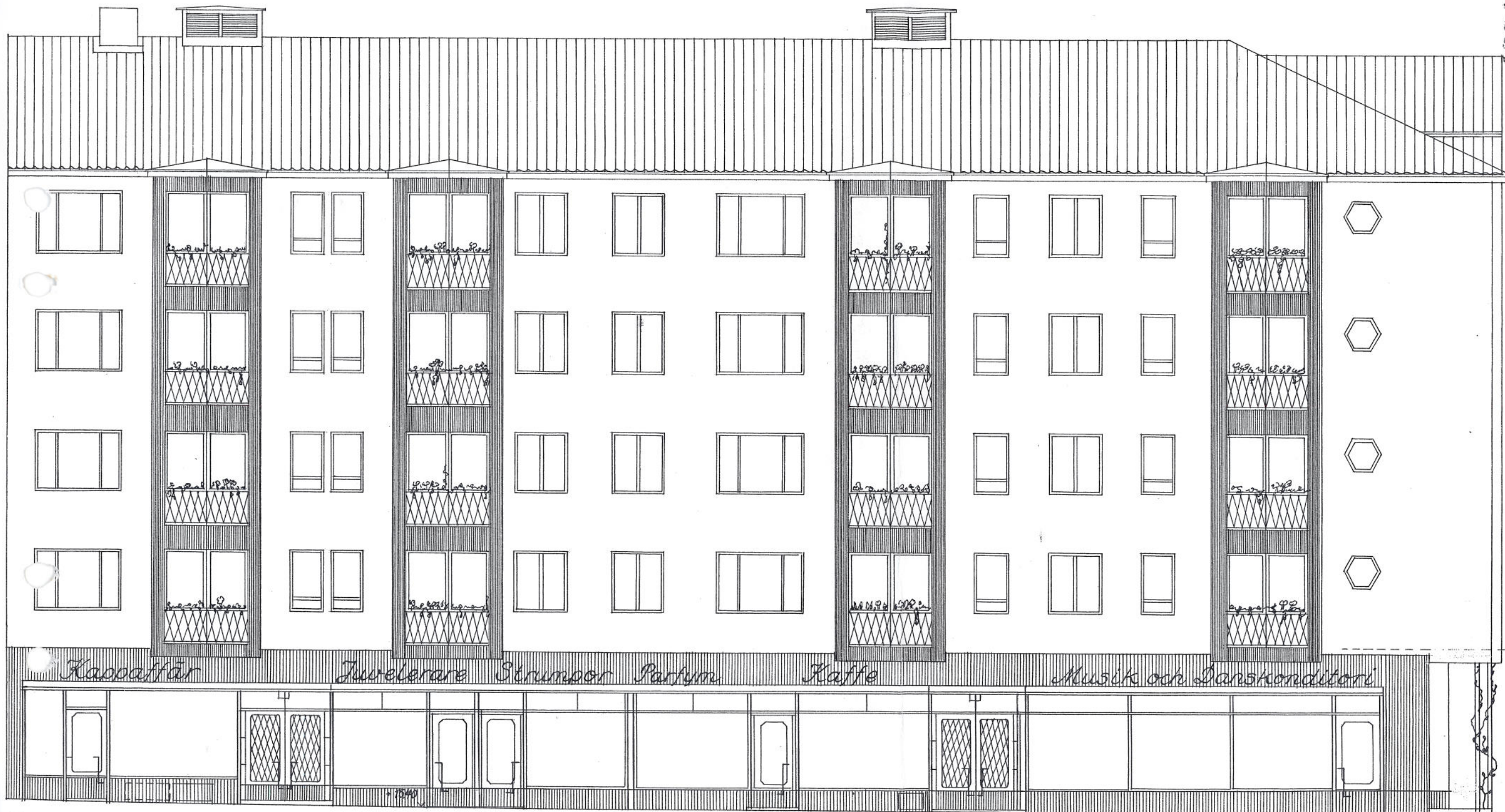
Fasad mot Fredsgatan